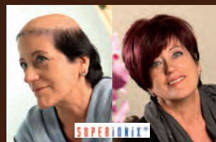
Stimulate Hairdesign 2019