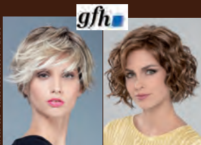
Wellness® ClassicCollection 2020